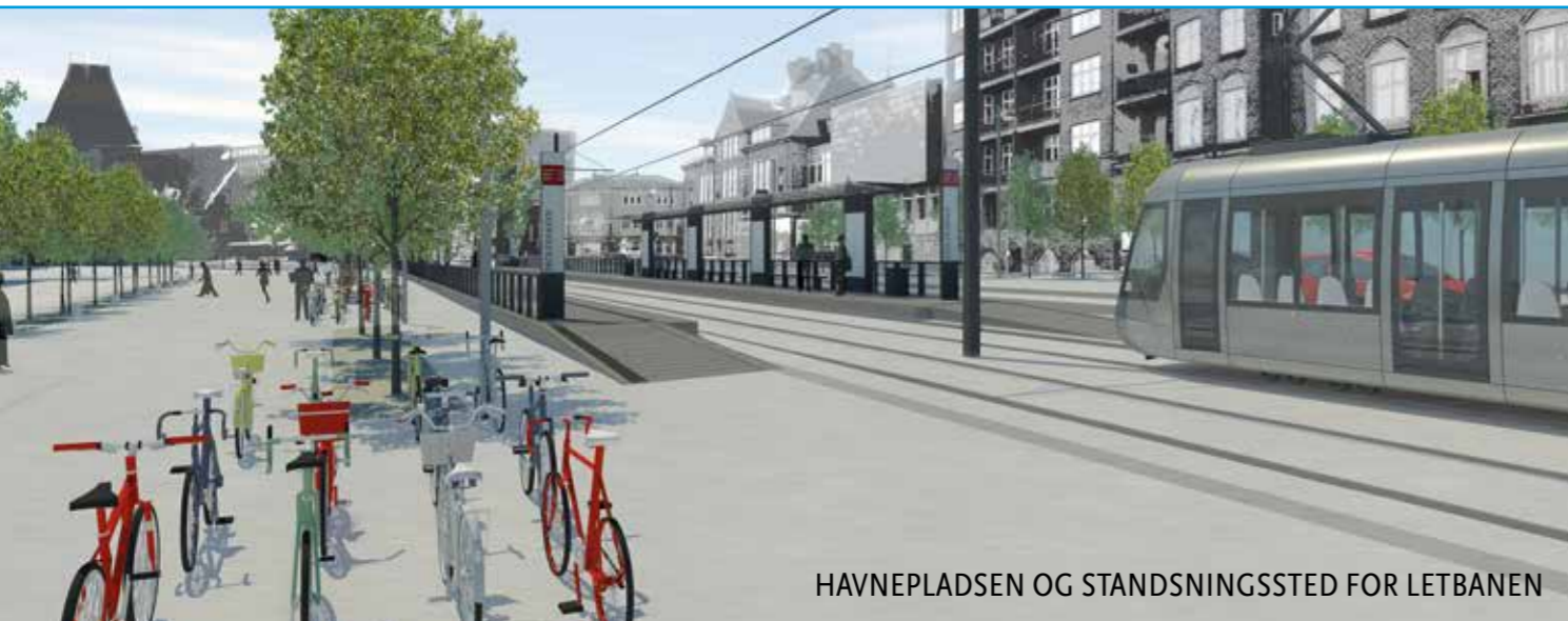
HAVNEPLADSEN OG STANDSNINGSSTED FOR LETBANEN

vil der være anlægsarbejde til Letbanen i 2014 og igen fra 2016. Med letbanen viser Aarhus vejen frem mod en by med en moderne og højt prioriteret kollektiv infrastruktur. Letbanen vil sammen med et net af cykel- og busruter bidrage til, at der i Aarhus vil være attraktive alternativer til bilen som transportmiddel.